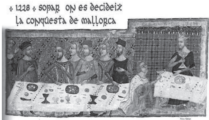
Figura 1. Jaime I comiendo ante su copero, en la otra mesa aparecen representados diferentes nobles. Crónica del siglo XIV

Por tanto, los señores ostentaron una función extraordinaria en muchos lugares para llevar a cabo esta colonización, en un primer momento como un dificultoso intento